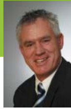
Liebe Bavendorferinnen und Bavendorfer,

Ergebnispräsentation, Diskussion und Würdigung